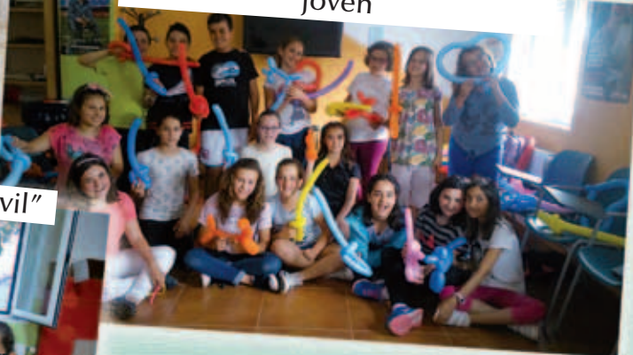
Taller de Globoflexia en el centro joven