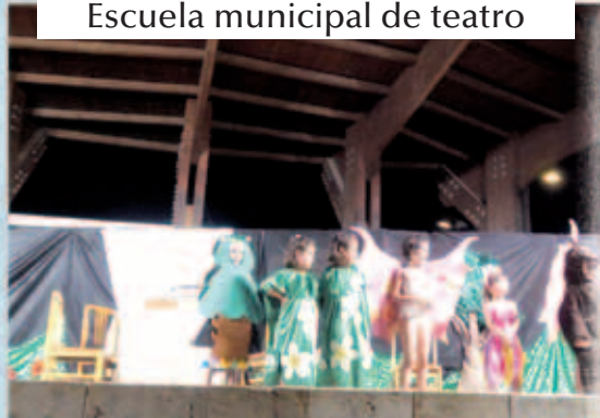
Escuela municipal de teatro