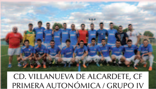
CD. VILLANUEVA DE ALCARDETE, CF PRIMERA AUTONÓMICA / GRUPO IV TEMPORADA 2015-2016