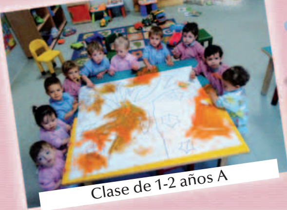
Clase de 1-2 años A