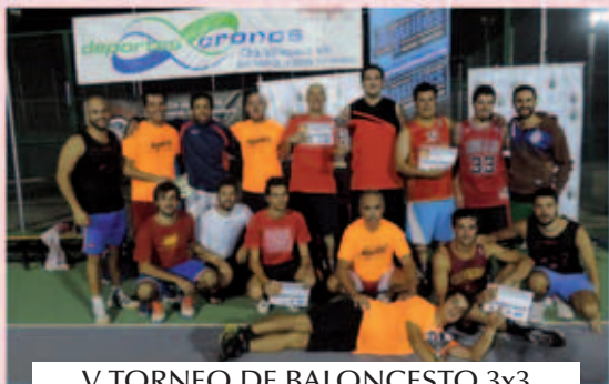
V TORNEO DE BALONCESTO 3x3 VERANO 2015