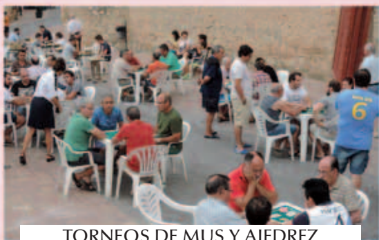
TORNEOS DE MUS Y AJEDREZ FIESTAS DEL CRISTO 2015