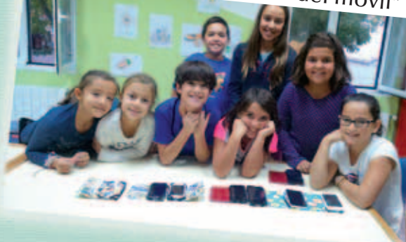
Taller «Crea tu funda del móvil»