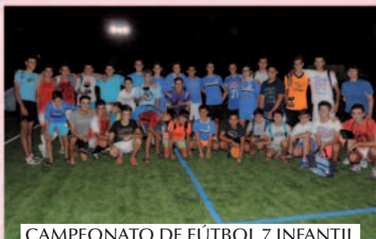
CAMPEONATO DE FÚTBOL 7 INFANTIL Y CADETE / VERANO 2015