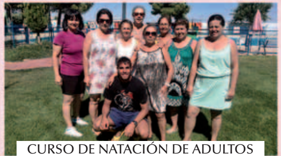
CURSO DE NATACIÓN DE ADULTOS VERANO 2015