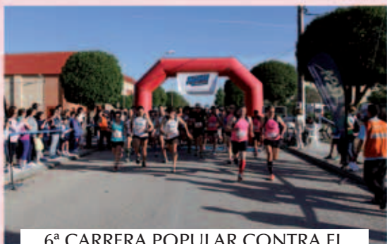
6ª CARRERA POPULAR CONTRA EL ALZHEIMER AFAD / MAYO 2015