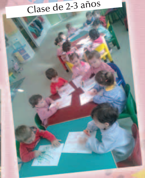
Clase de 2-3 años