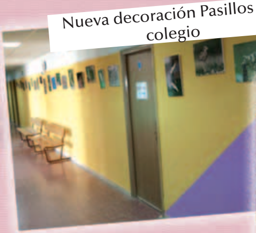
Nueva decoración Pasillos del colegio