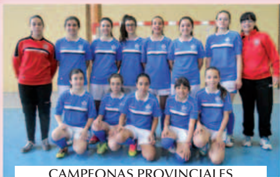
CAMPEONAS PROVINCIALES CADETES DE FÚTBOL SALA TEMPORADA 2014-2015