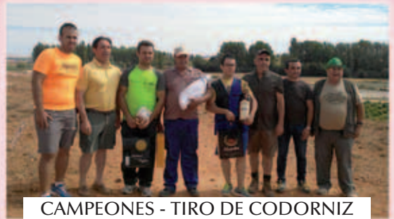
CAMPEONES - TIRO DE CODORNIZ FIESTAS DEL CRISTO 2015