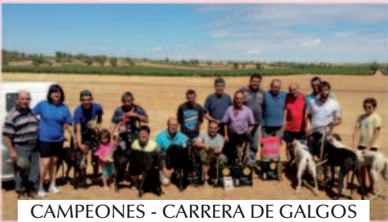
CAMPEONES - CARRERA DE GALGOS LOCAL / FIESTAS DEL CRISTO 2015