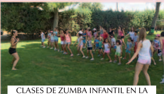
CLASES DE ZUMBA INFANTIL EN LA PISCINA MUNICIPAL – VERANO 2015