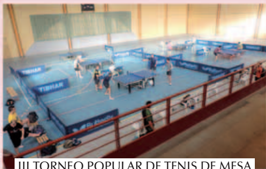
III TORNEO POPULAR DE TENIS DE MESA "MEMORIAL JOSÉ G. GARCÍA"