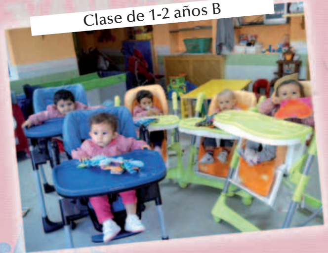
Clase de 1-2 años B