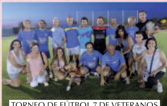
TORNEO DE FÚTBOL 7 DE VETERANOS VERANO 2015