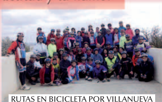
RUTAS EN BICICLETA POR VILLANUEVA VERANO 2015