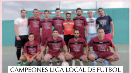
CAMPEONES LIGA LOCAL DE FÚTBOL SALA – VERANO 2015 / GIT. ACEÑA