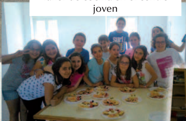
Taller de cocina en el centro joven