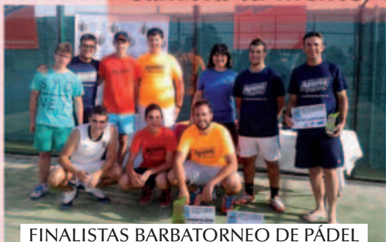
FINALISTAS BARBATORNEO DE PÁDEL MASCULINO / JULIO 2015