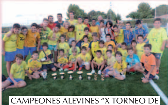
CAMPEONES ALEVINES "X TORNEO DE FÚTBOL BASE – CARLOS MORENO"