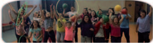
ESCUELA DE ZUMBA INFANTIL CURSO 2014-2015