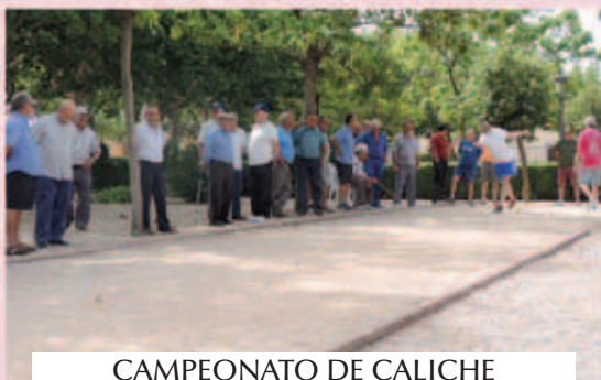
CAMPEONATO DE CALICHE FIESTAS DEL CRISTO 2015