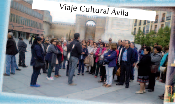
Viaje Cultural Ávila