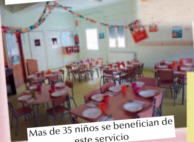
Mas de 35 niños se benefician de este servicio