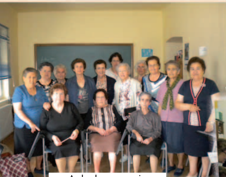
Aula de memoria