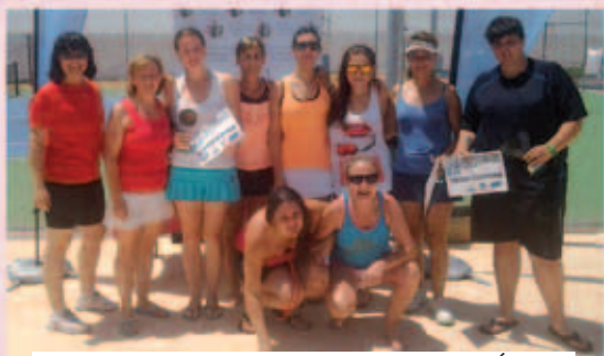
FINALISTAS BARBATORNEO DE PÁDEL FEMENINO / JULIO 2015