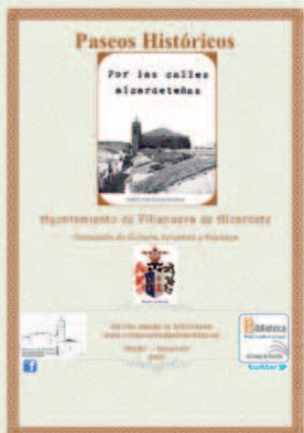
Próximas rutas históricas por Villanueva