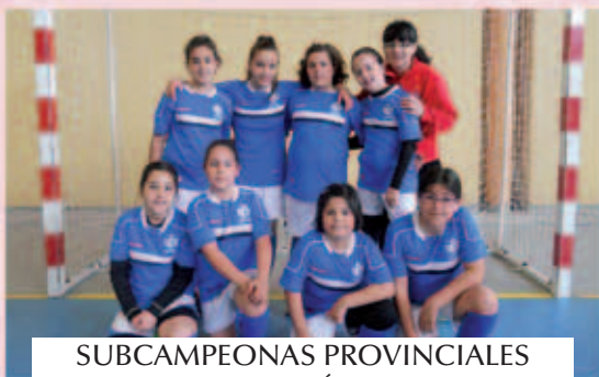
SUBCAMPEONAS PROVINCIALES ALEVINES DE FÚTBOL SALA TEMPORADA 2014-2015