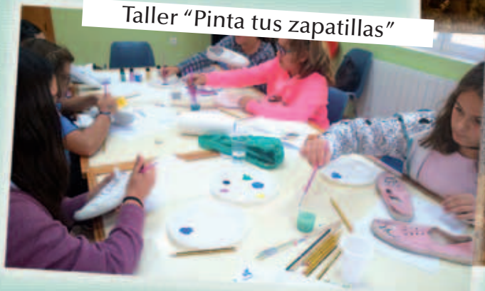
Taller «Pinta tus zapatillas»