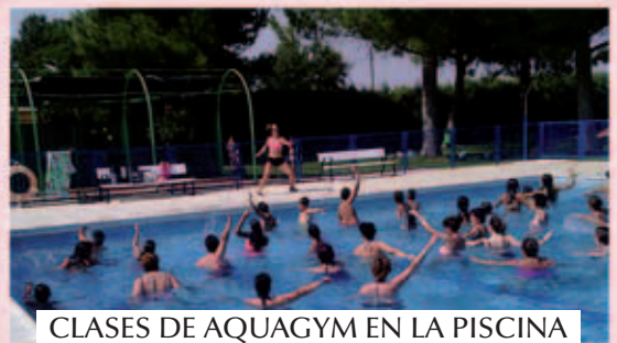
CLASES DE AQUAGYM EN LA PISCINA MUNICIPAL – VERANO 2015