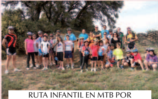
RUTA INFANTIL EN MTB POR VILLANUEVA / MAYO 2015