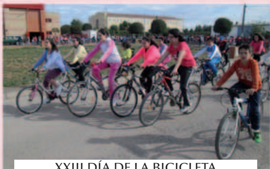
XXIII DÍA DE LA BICICLETA 1 MAYO 2015