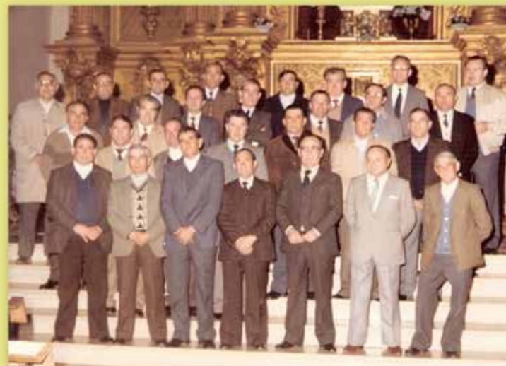
SAN JORGE 1991