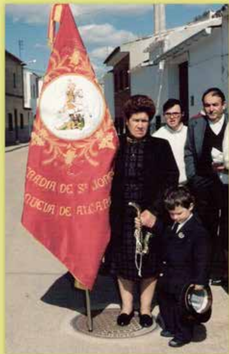
QUINTA DEL 51