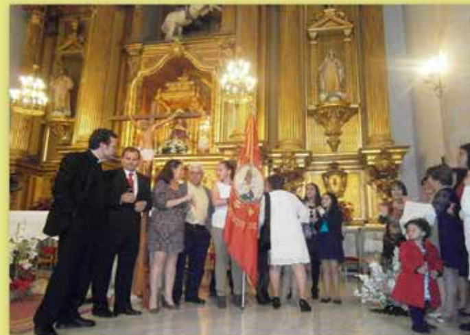
COGIDA DE BANDERA 2014